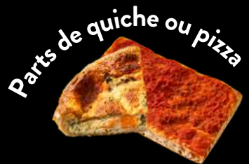
Parts de quiche ou pizza